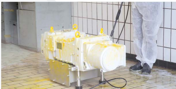
DRYVAC DV 650 FP-r 適用於沖洗環境的設計

深入瞭解我們的乾式壓縮耐用真空幫浦 DRYVAC DV 650 。我們灌入 10 公升的水， 證實已通過耐用測試：